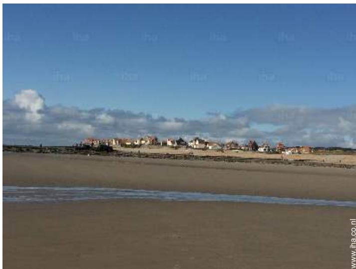
uitzicht op zee