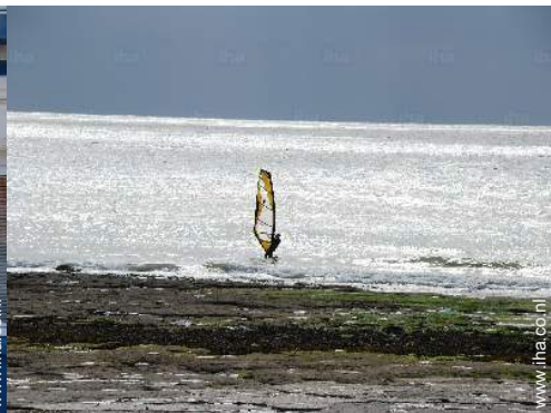
vrijetijds besteding in de nabijheid