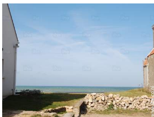
uitzicht op zee