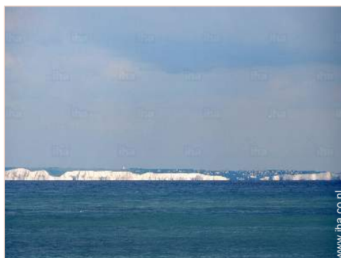
Zicht op zee