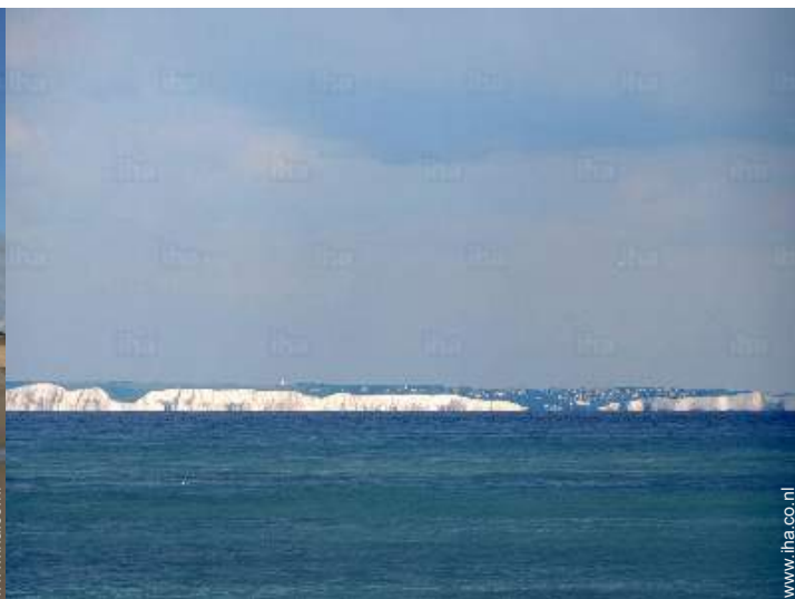
Zicht op zee