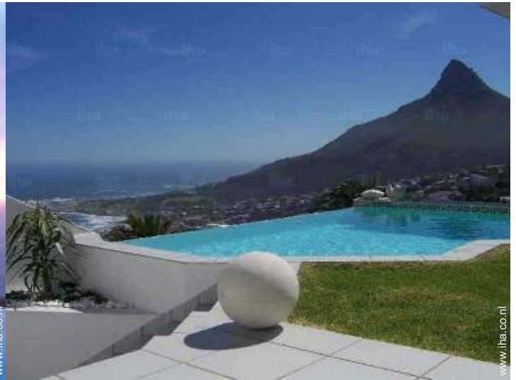
uitzicht vanaf de patio