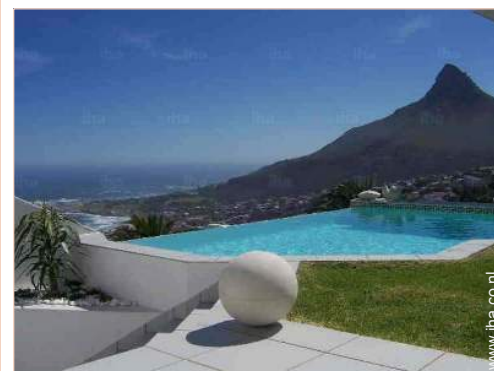
uitzicht vanaf de patio