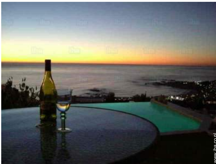
uitzicht op zonsondergang