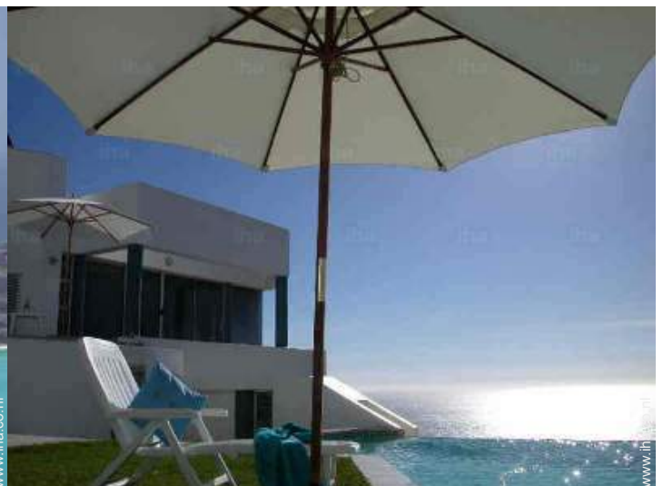
uitzicht vanuit het zwembad