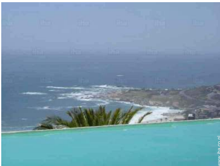
Zicht op zee