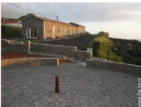
Charmant Huis uit Natuursteen

Voordelen : Directe toegang tot het strand