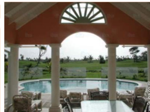
uitzicht vanaf de patio

Gasbarbecue, tuintafel(s), 8 tuintoel(en), 8 ligstoel(en)