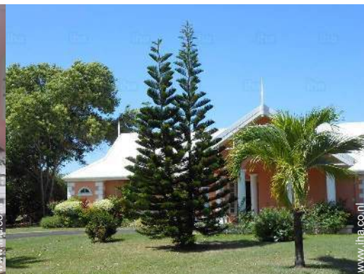
uitzicht vanuit de tuin/park