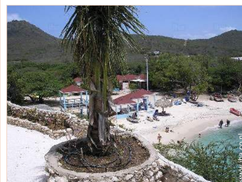
uitzicht vanuit het overdekte terras

Bushalte/busstation <50m Autoverhuur <50m Verhuur van duikmateriaal <50m Verhuur linnengoed/wasserij <50m Kleine winkeltjes 300m Supermarkt 3km Bank 3km Geldautomaat 3km Apotheek 3km Dokter 3km Ziekenhuis 25km