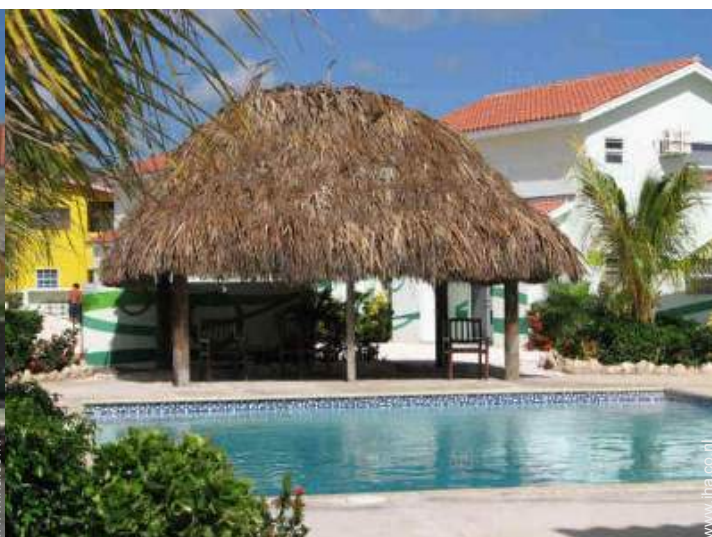
uitzicht vanuit het zwembad