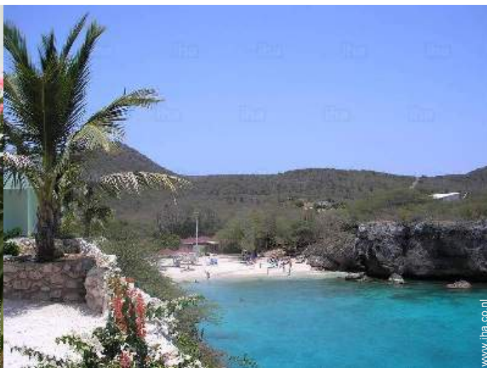
uitzicht vanuit het huis