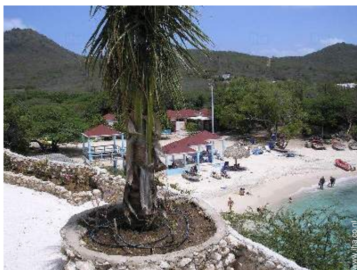
uitzicht vanuit het overdekte terras