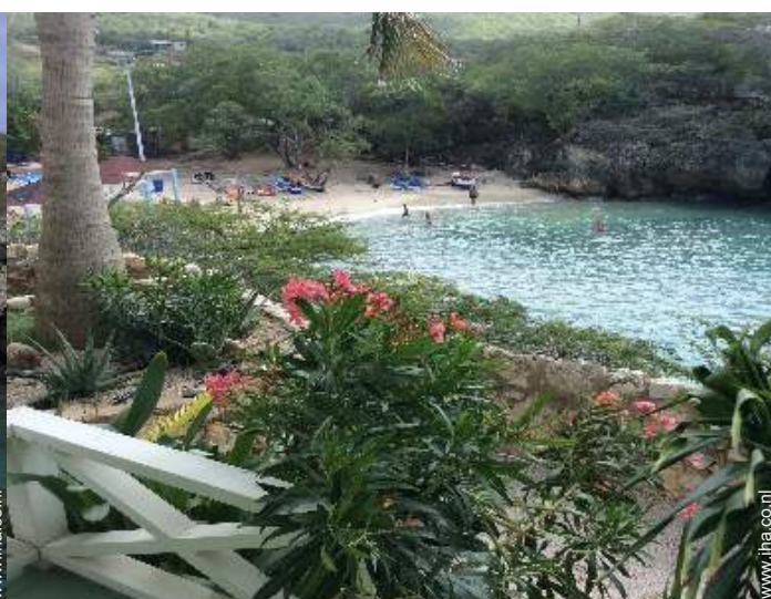
uitzicht vanuit het overdekte terras