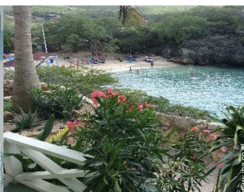
directe toegang tot het strand