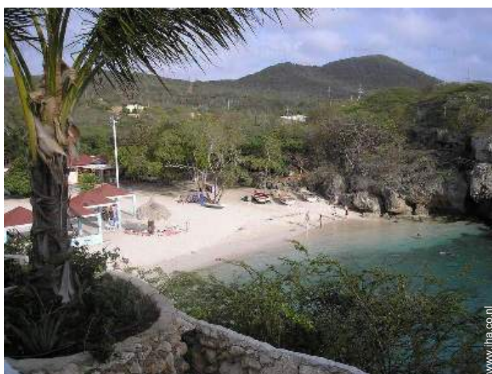
uitzicht vanaf de veranda