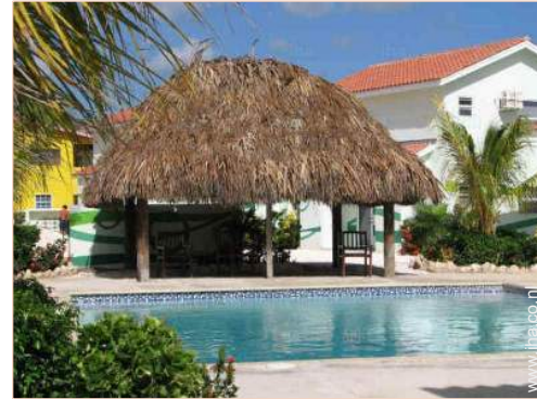
uitzicht vanuit het zwembad