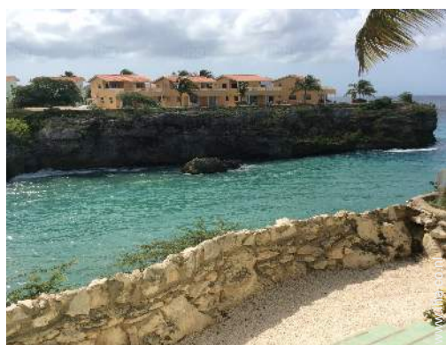
uitzicht vanaf de veranda