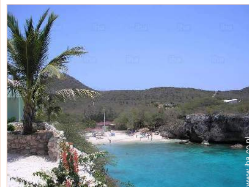
uitzicht vanuit het huis