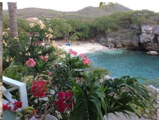
uitzicht vanuit het overdekte terras