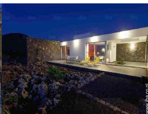
uitzicht vanuit de tuin/park