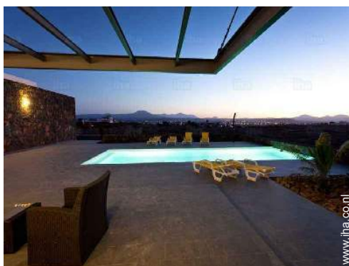
uitzicht vanuit de eetkamer