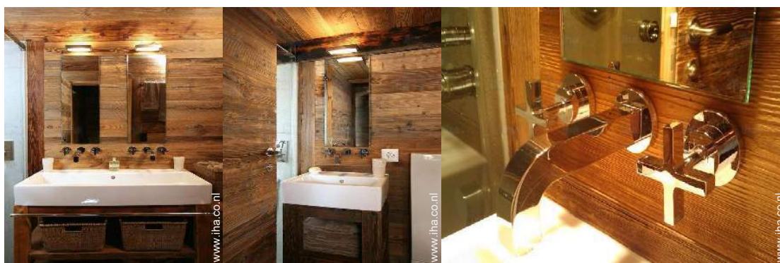
Badkamer(s) met douche