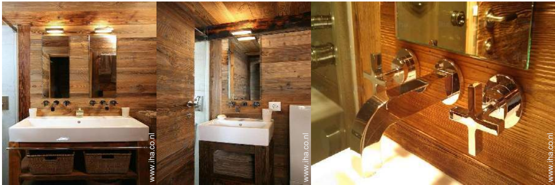
Badkamer(s) met douche