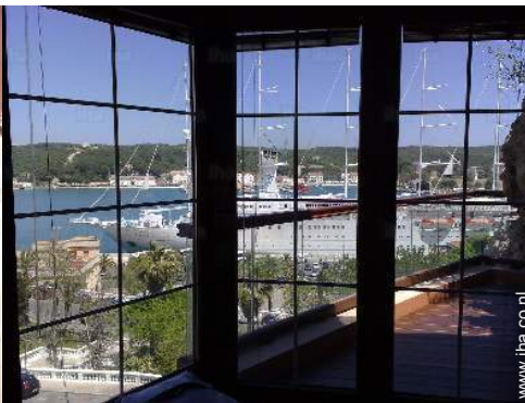
uitzicht vanuit het huis