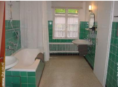
Badkamer(s) met bad