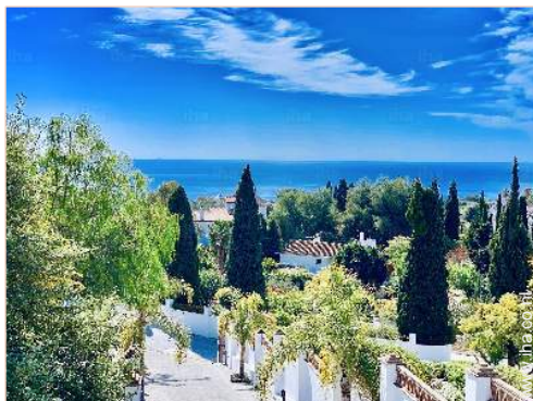
uitzicht vanuit het huis