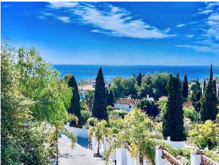
uitzicht vanuit het huis