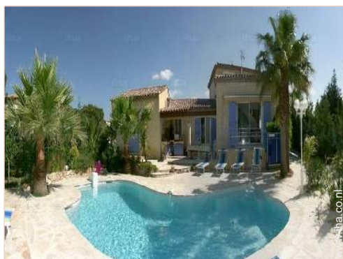
uitzicht op tuin/park

Kinderstoel, Baby Commode, kinderpotje, kinderbox, kinderwagen