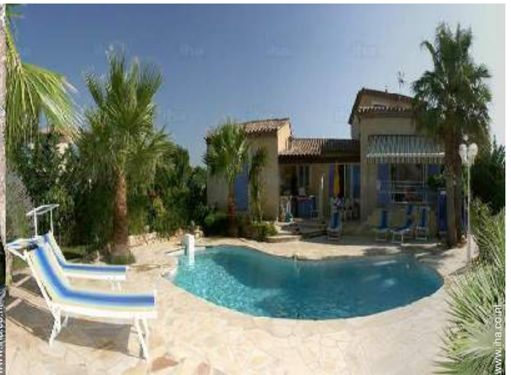
uitzicht vanuit het overdekte terras