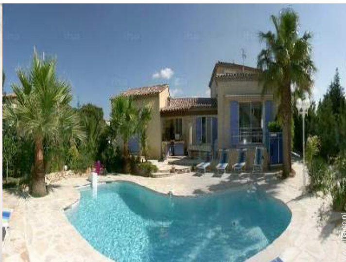
uitzicht op tuin/park