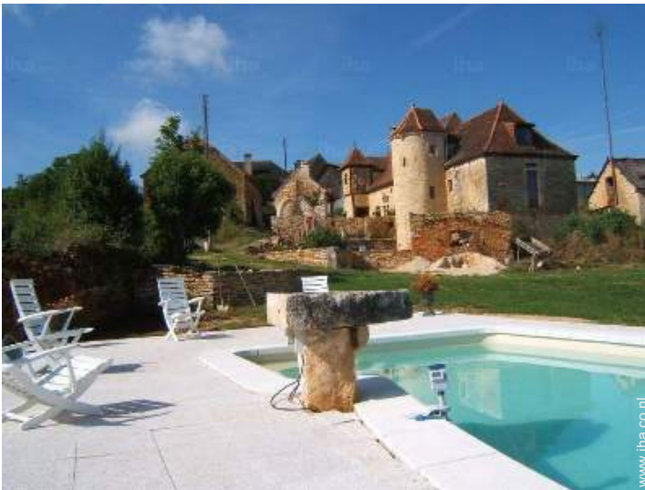
uitzicht vanuit het zwembad