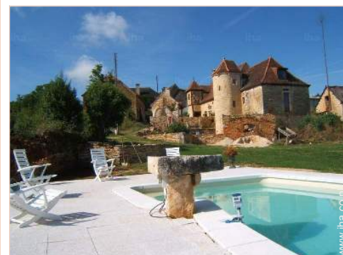
uitzicht vanuit het zwembad