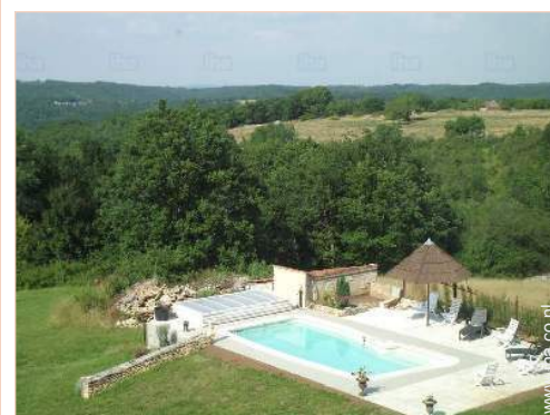
uitzicht op zwembad

Stadscentrum 10km Fiets/mountainbike verhuur 10km Bakker 10km Kleine winkeltjes 10km Supermarkt 10km Postkantoor 10km Bank 10km Dokter 10km