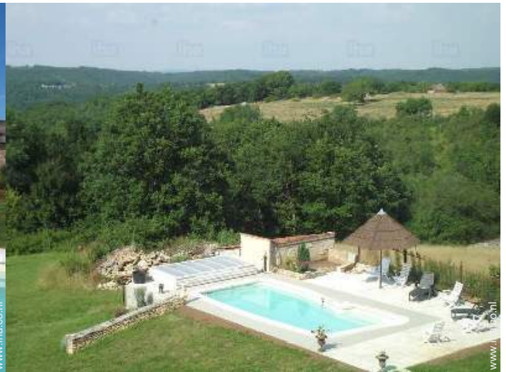
uitzicht op zwembad