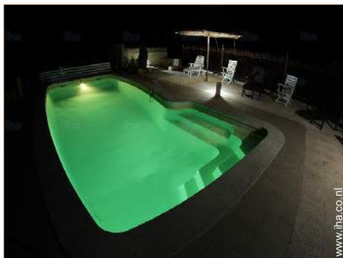
uitzicht op zwembad