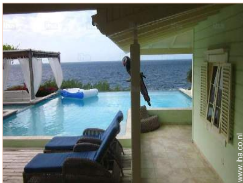
uitzicht vanuit het overdekte terras