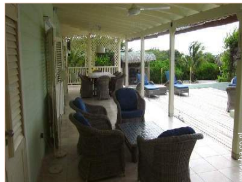
uitzicht vanuit het overdekte terras

Gasbarbecue, tuintafel(s), 8 tuinstoel(en), 4 ligstoel(en), 2 strandstoel(en), Openlucht douche, WC buiten