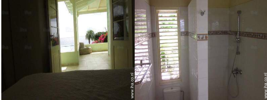
uitzicht vanaf de veranda