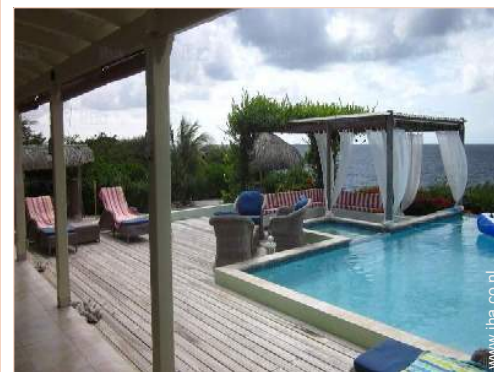
uitzicht op zwembad