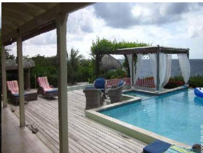
uitzicht op zwembad