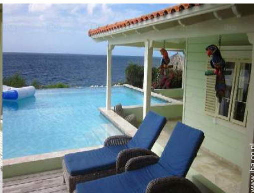
uitzicht op zee