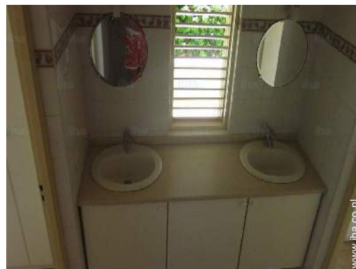
Badkamer(s) met douche