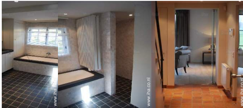
Badkamer(s) met bad