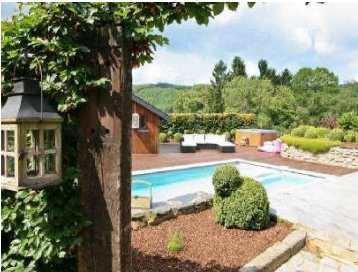
uitzicht op zwembad