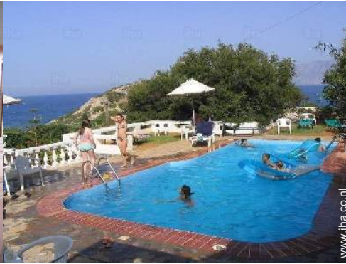
uitzicht op zwembad