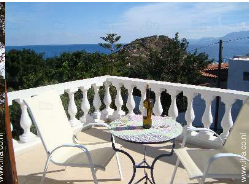
uitzicht vanaf het balkon