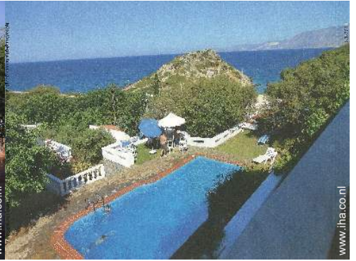
uitzicht op zwembad