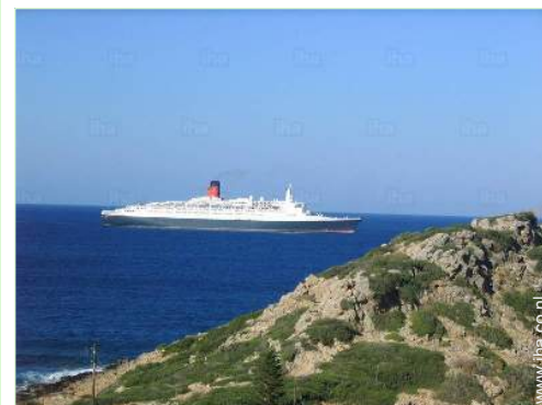
uitzicht vanaf het balkon

Stadscentrum 5km Bushalte/busstation 300m Verhuur van motoren/scooters 500m Autoverhuur 500m Bootverhuur 5km Verhuur van duikmateriaal 5km Bakker 50m Kleine winkeltjes 50m Supermarkt 5km Kapsalon 5km Cybercafé 5km Postkantoor 5km Bank 5km Geldautomaat 5km Apotheek 5km Dokter 5km Ziekenhuis 5km