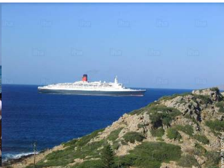
uitzicht vanaf het balkon