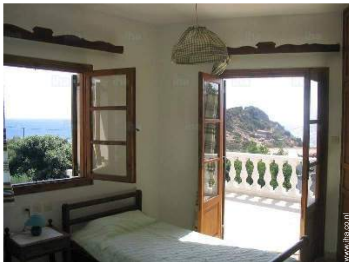
overzicht van het bezit