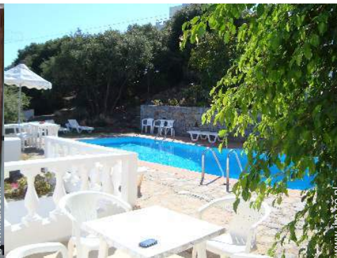
uitzicht op zwembad