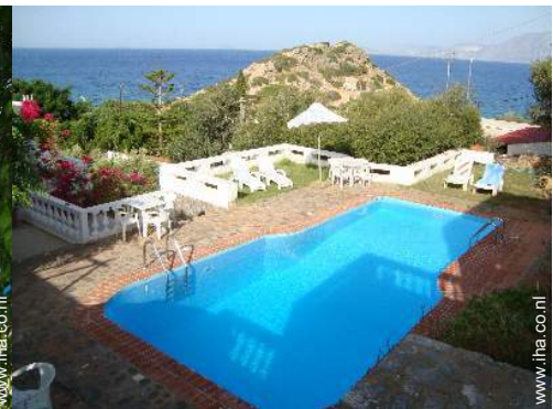
Zicht op zee