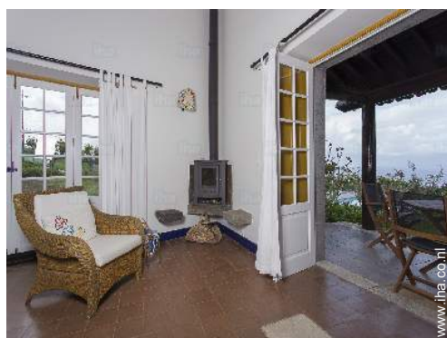
uitzicht vanuit de woonkamer