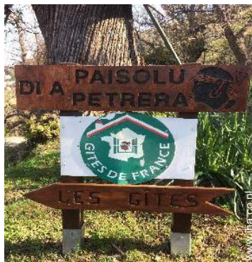
Ter plekke aanwezig