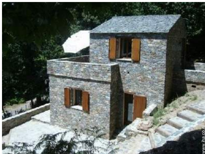
uitzicht op de bergen