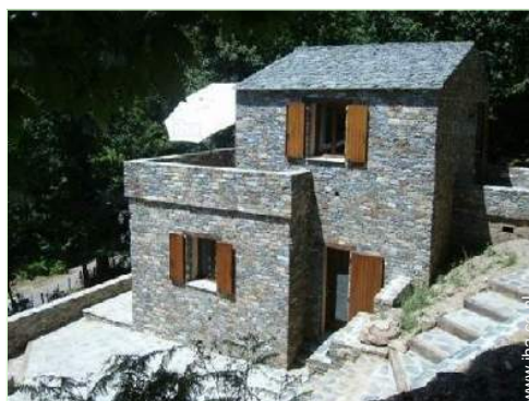
uitzicht op de bergen