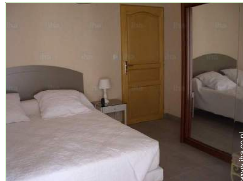
Slaapplaatsen - bed(den)