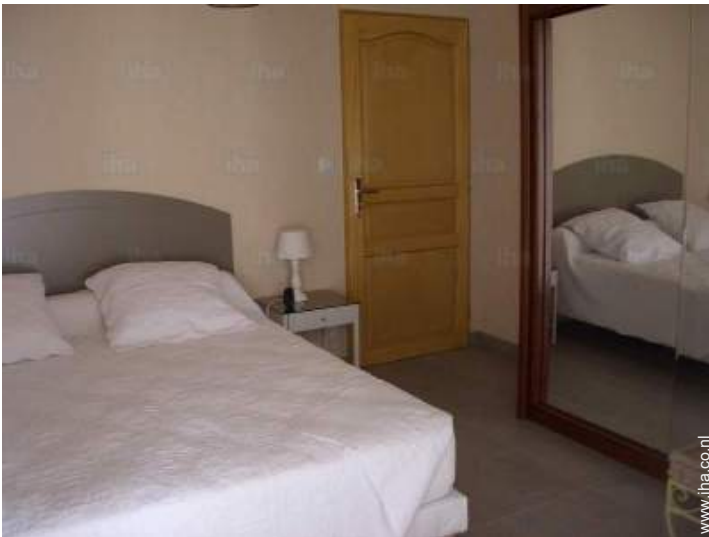
Slaapplaatsen - bed(den)