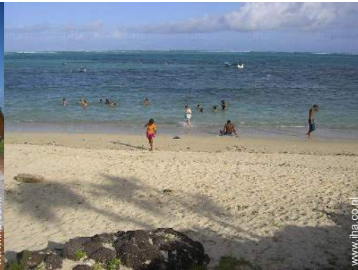
uitzicht op zee