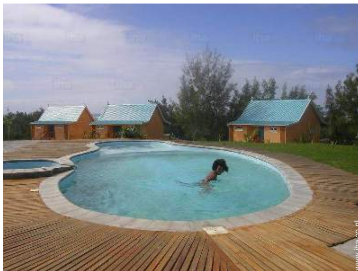
uitzicht op zwembad