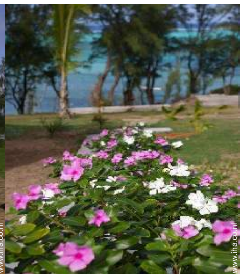
uitzicht op tuin/park