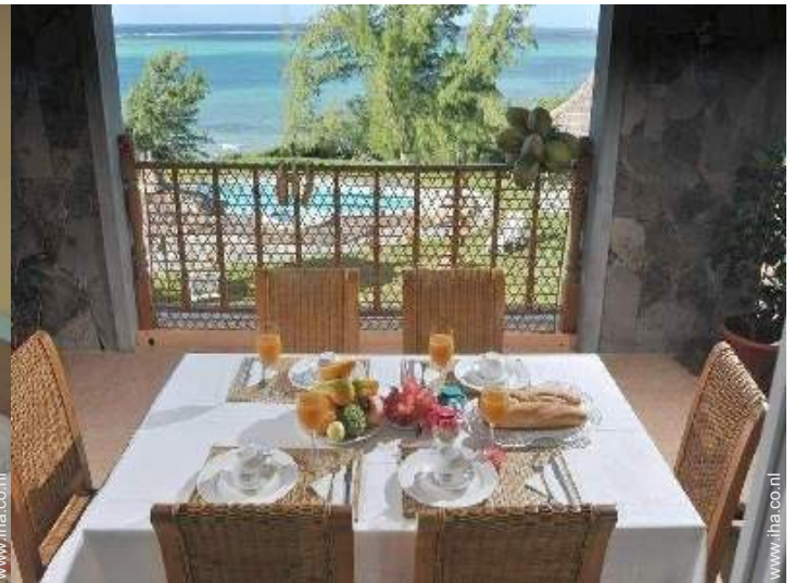
uitzicht vanuit de eetkamer