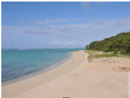
Zicht op zee