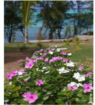
uitzicht op tuin/park

Openlucht keuken, zomerkamer, openlucht bar, barbecue, tuintafel(s), 10 tuinstoel(en), tongewelf, parasol, serre, 14 ligstoel(en), 2 hangmat(ten)