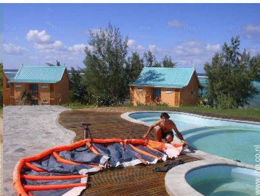
uitzicht vanuit het zwembad