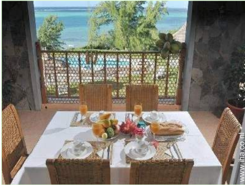
uitzicht vanuit de eetkamer