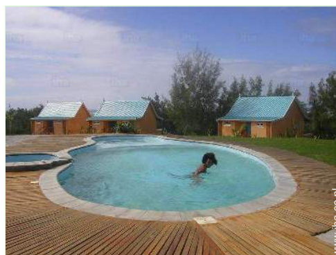
uitzicht op zwembad

Rolstoeltoegang Geschikt voor gehandicapten : motorisch