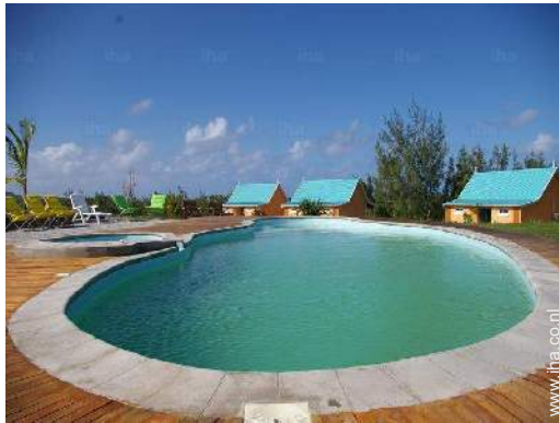
uitzicht vanuit het zwembad