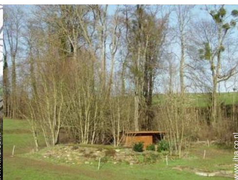
uitzicht vanuit de zitzkamer