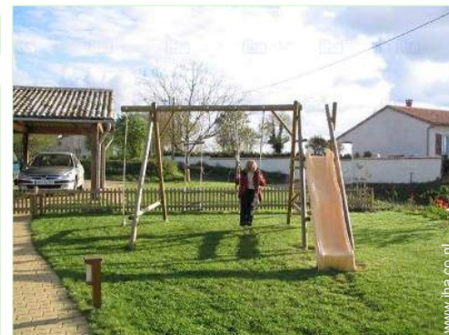
uitzicht vanuit de keuken

Barbecue, tuintafel(s), 4 tuinstoel(en), parasol, serre, 4 ligstoel(en), 2 strandstoel(en), zandbak, Openlucht douche