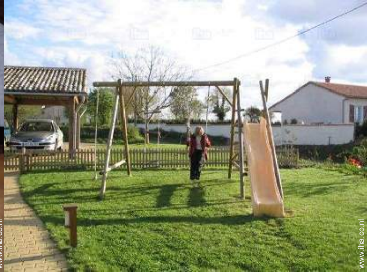
uitzicht vanuit de keuken