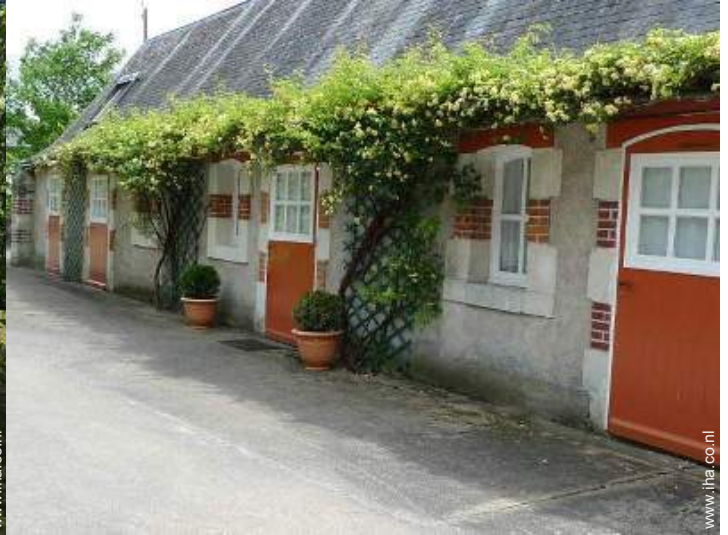
Charmant Huis uit Natuursteen