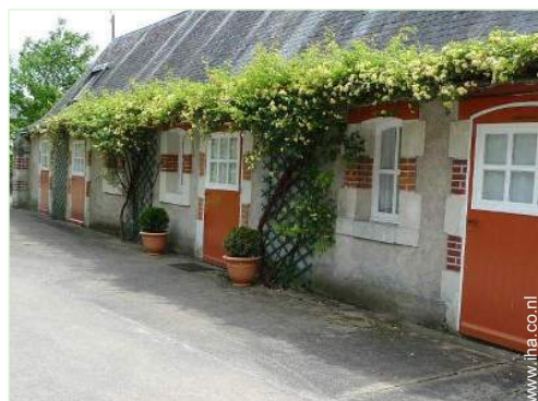
Charmant Huis uit Natuursteen

Kinderstoel, babybadje, kinderpotje, kinderbox