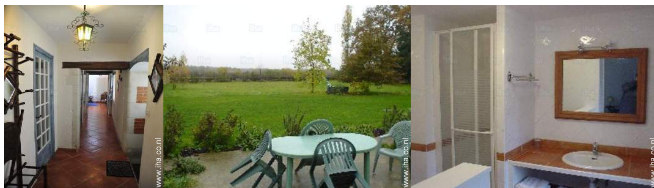
Binnenhuis inrichting en comfort