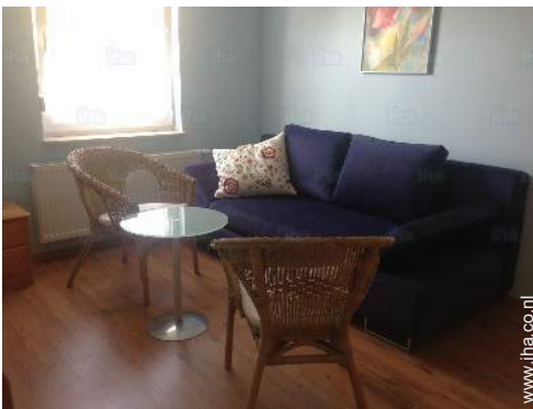
slaapbank(en) 2 pers