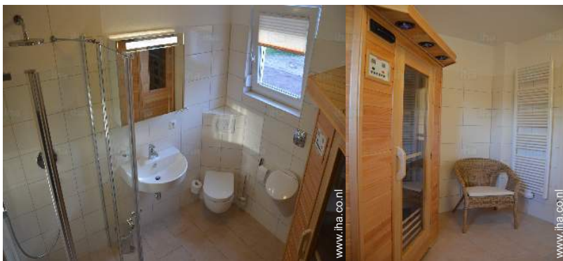
Badkamer(s) met bad