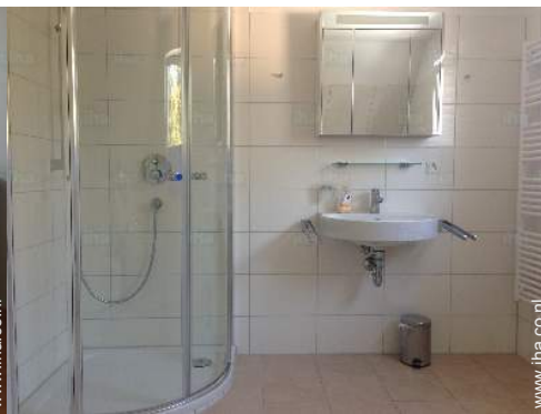
Badkamer(s) met bad