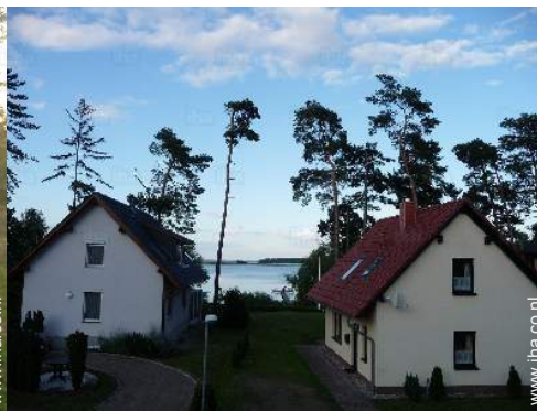
uitzicht vanuit de kamer