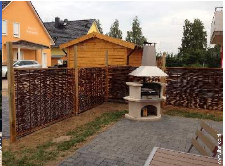
uitzicht vanaf het terras