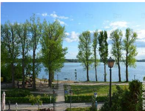
Nabij gelegen steden