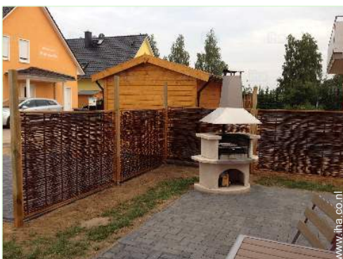
uitzicht vanaf het terras