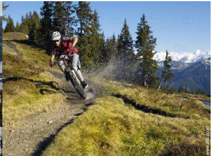
zomeractiviteiten in de omgeving