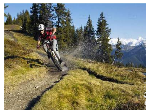
zomeractiviteiten in de omgeving

Postkantoor Bank Geldautomaat Apotheek Dokter