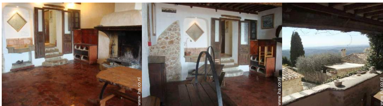
uitzicht vanuit het appartement