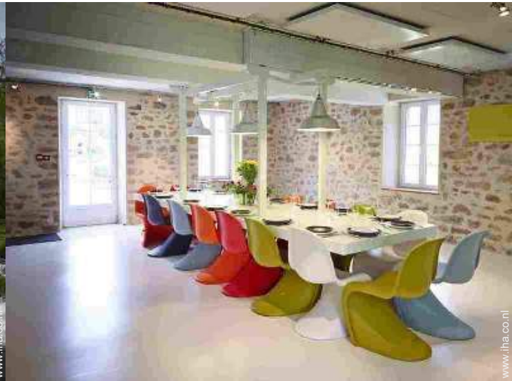
uitzicht vanuit de eetkamer