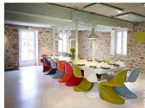
uitzicht vanuit de eetkamer