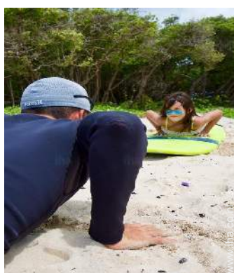
directe toegang tot het strand