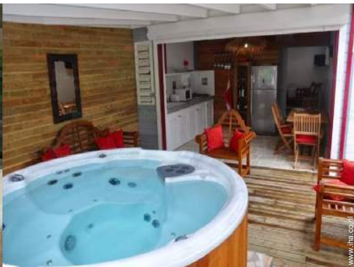
grote aparte keuken