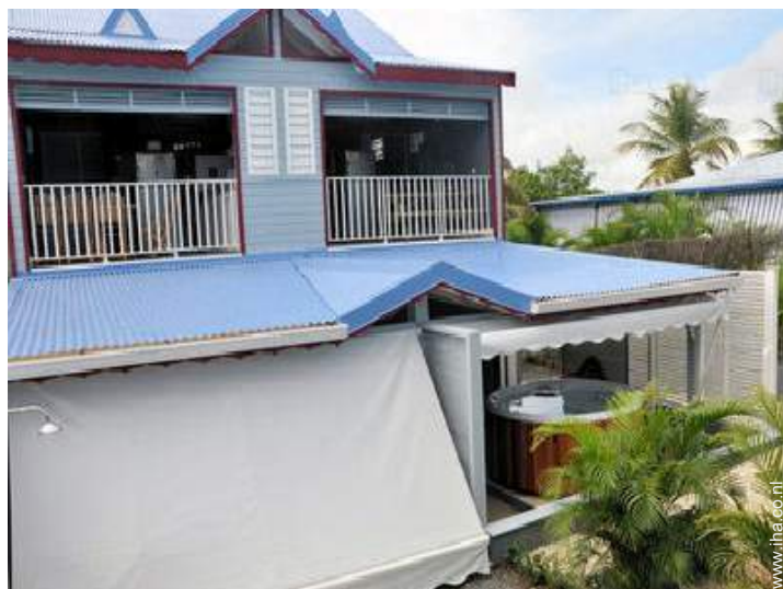
directe toegang tot het strand