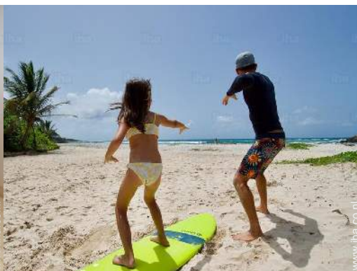
directe toegang tot het strand