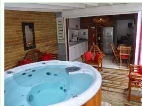
grote aparte keuken