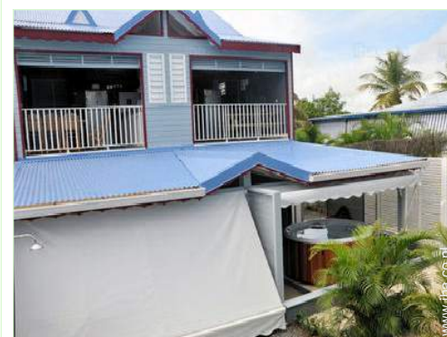
directe toegang tot het strand

Zandstrand 500m Kiezelstrand 200m Openbare tennisbaan 5km 18-holes golfparcours 5km Surf spot 200m Pleziervaarhaven 5km