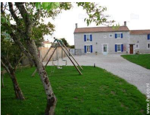
overzicht van het bezit