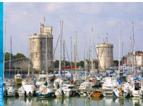
Nabij gelegen steden