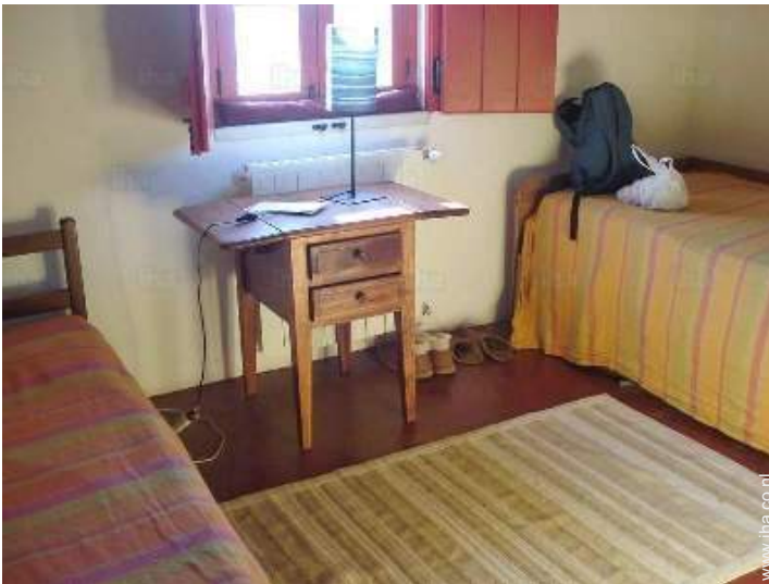
Slaapplaatsen - bed(den)