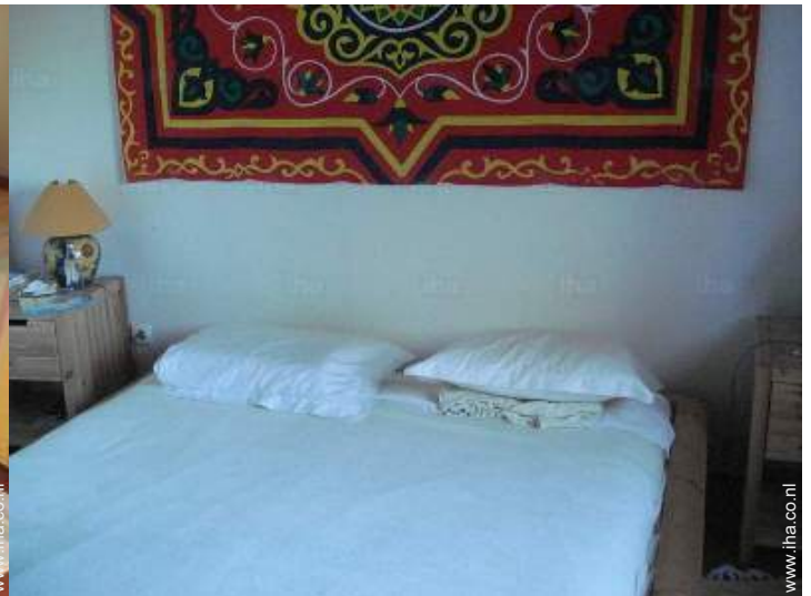
Slaapplaatsen - bed(den)