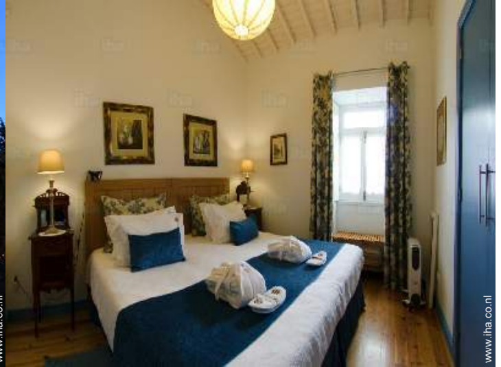
king size bed(den)