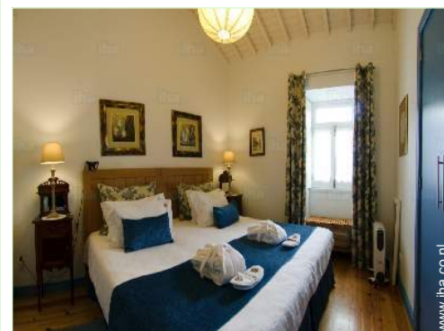
king size bed(den)