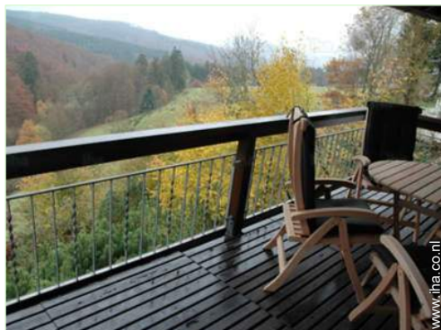
uitzicht op de bossen

Kinderstoel, Baby Commode, babybadje, kinderpotje, kinderwagen