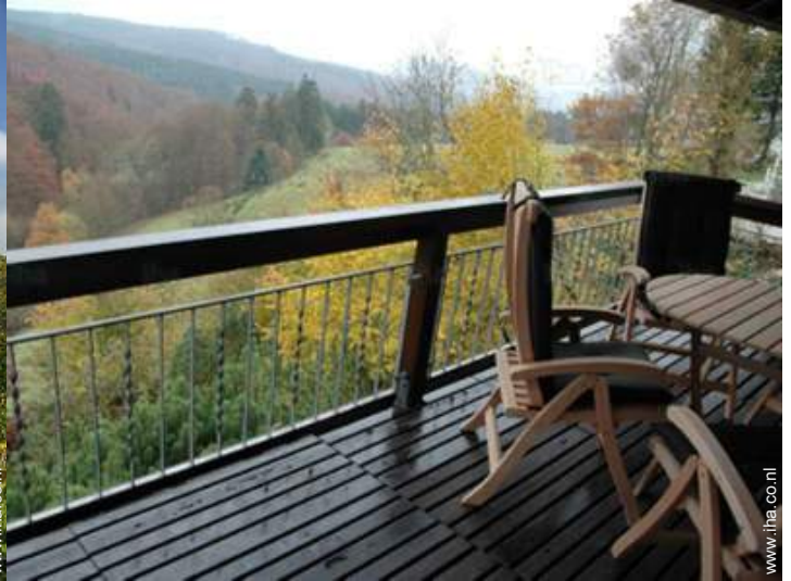
uitzicht op de bossen