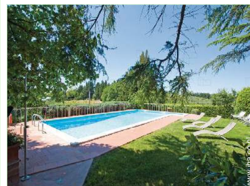
uitzicht op zwembad