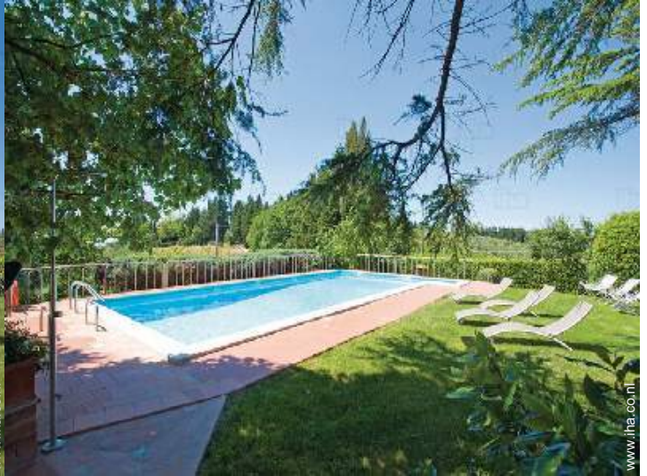
uitzicht op zwembad