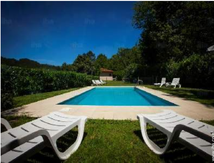
uitzicht vanuit het zwembad