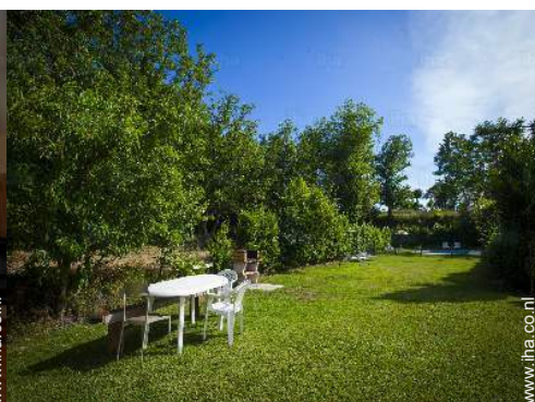
uitzicht vanuit het zwembad