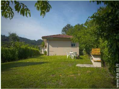
uitzicht op tuin/park