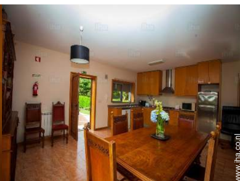
uitzicht vanuit de eetkamer