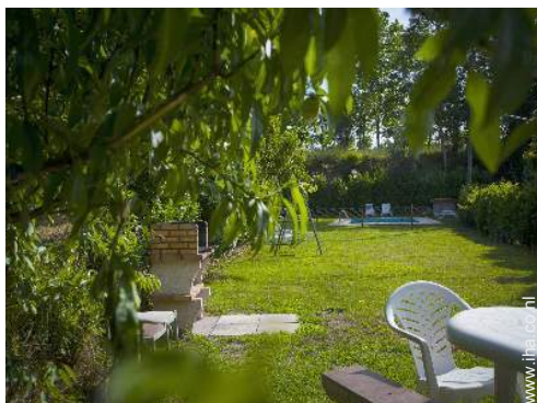
uitzicht vanuit de tuin/park