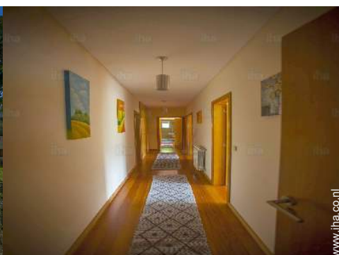
uitzicht vanuit het huis