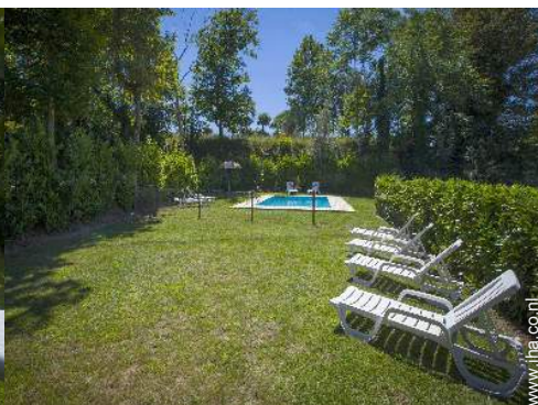
uitzicht vanuit het zwembad