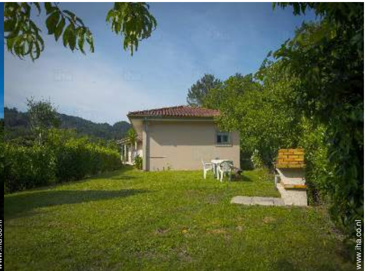
uitzicht op tuin/park