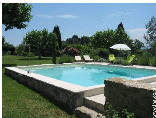
uitzicht op zwembad