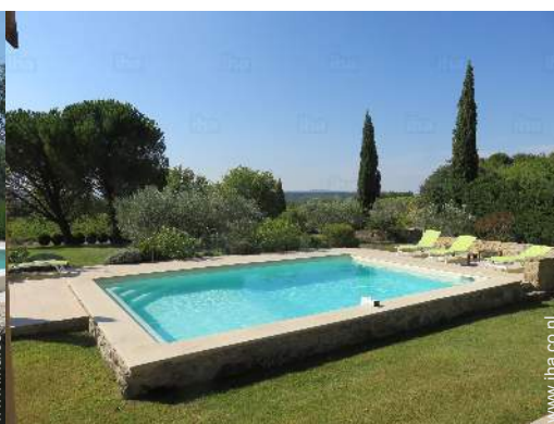
uitzicht op zwembad