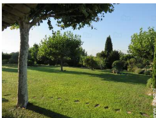
uitzicht op tuin/park