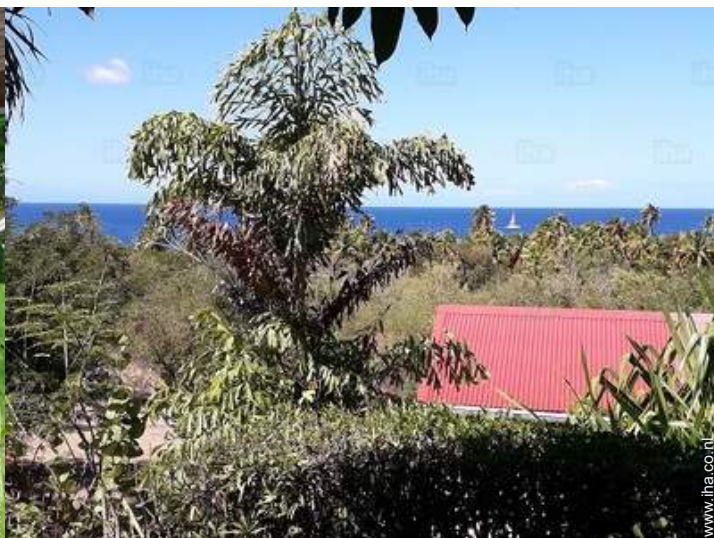
uitzicht vanuit het overdekte terras