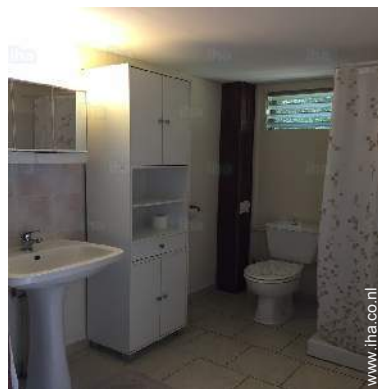
Badkamer(s) met douche