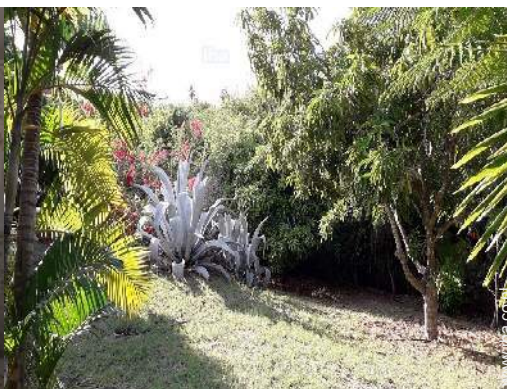
uitzicht vanuit het overdekte terras