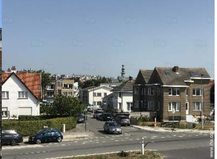
uitzicht vanaf het balkon