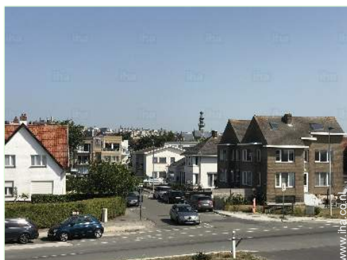
uitzicht vanaf het balkon

Voordelen : Directe toegang tot het strand