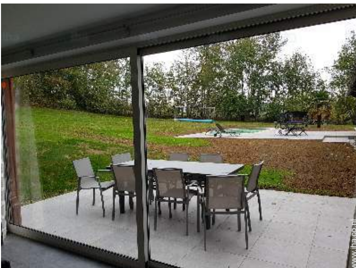
uitzicht vanuit het huis