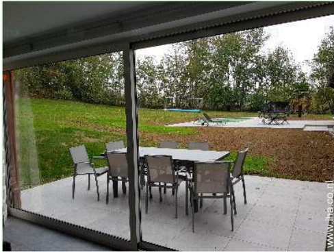
uitzicht vanuit het huis