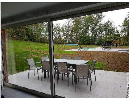
uitzicht vanuit het huis