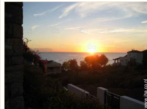
uitzicht op zee