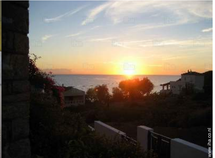
uitzicht op zee