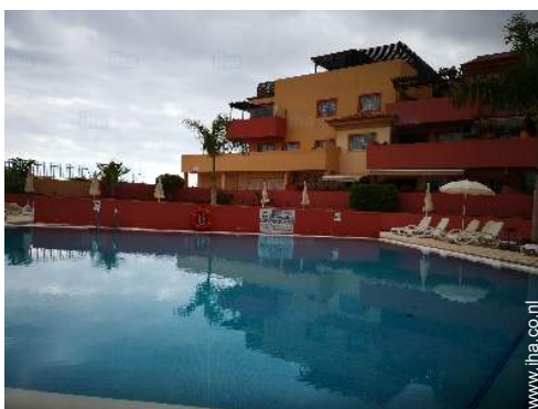
uitzicht op zwembad