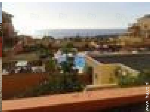
uitzicht vanaf het balkon