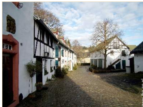
uitzicht op dorpscentrum