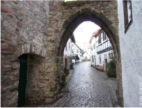
uitzicht op voetgangersgebied