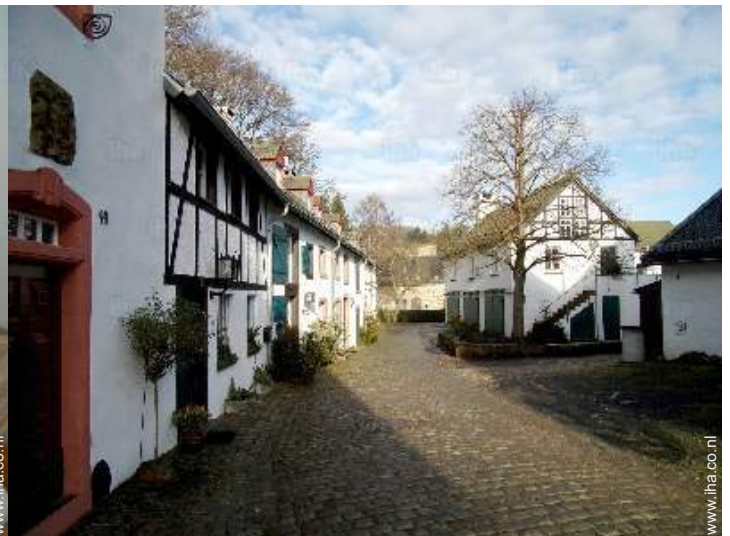
uitzicht op dorpscentrum