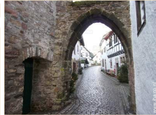
uitzicht op voetgangersgebied

Barbecue, tuintafel(s), 8 tuinstoel(en), parasol, 2 strandstoel(en)