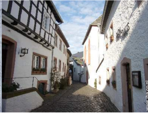
uitzicht op voetgangersgebied