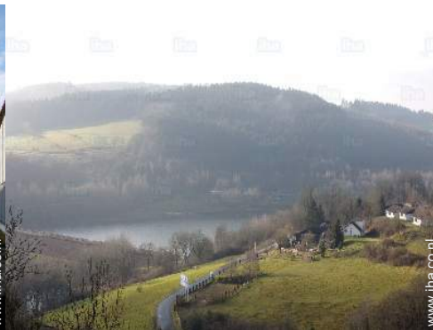
watersportactiviteiten in de omgeving