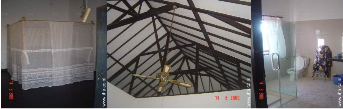
king size bed(den)