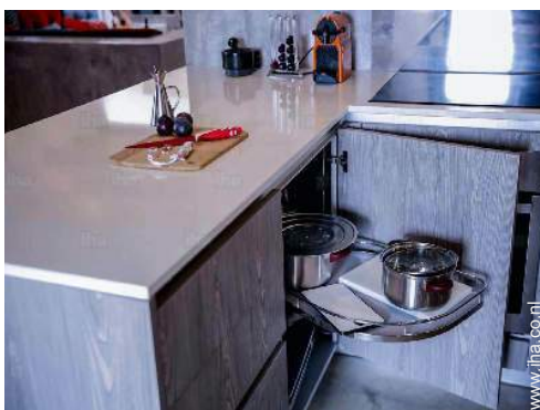
huishoudelijke artikelen en keukengerei