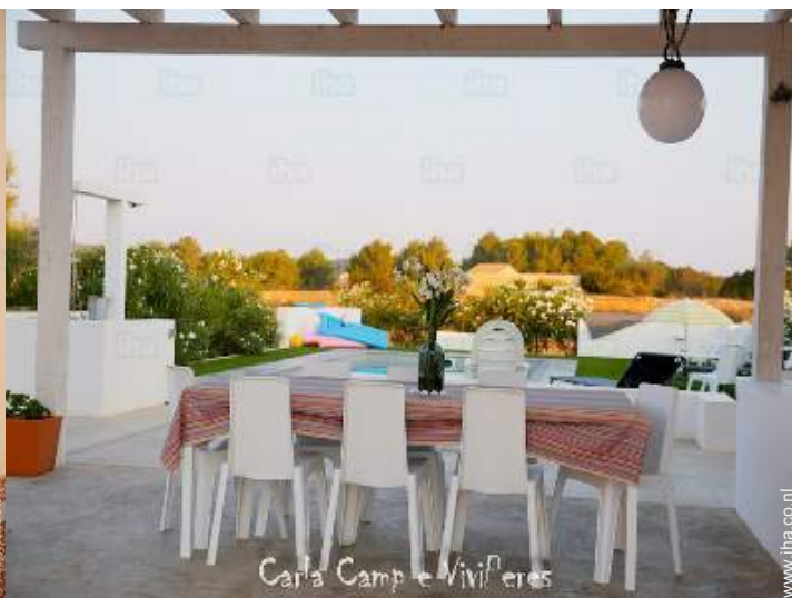
Carla Camp e Vivieres