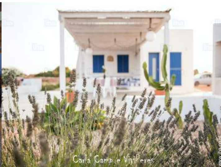
Carla Camp e Vivieres