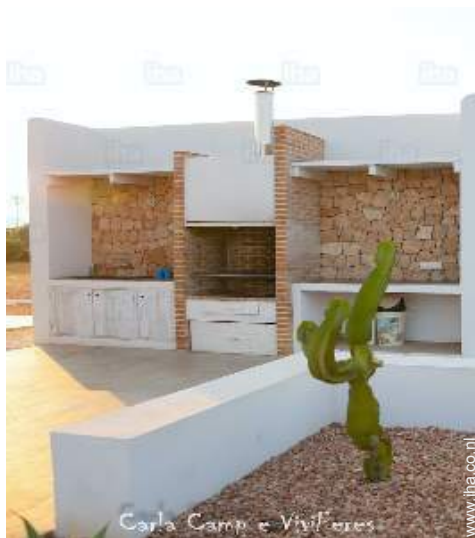
Carla Camp e Vivieres