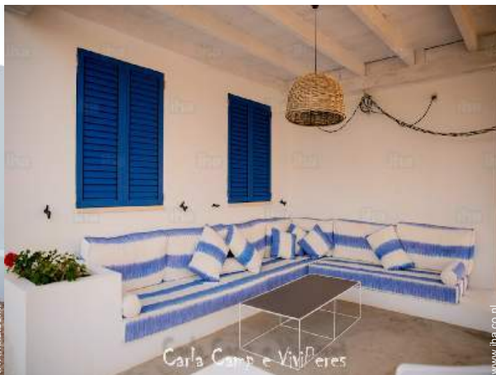
Carla Camp e Vivieres