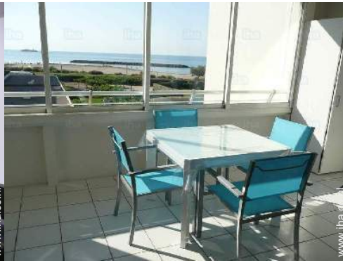
uitzicht vanuit het appartement