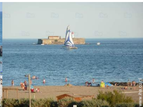
uitzicht vanuit het appartement