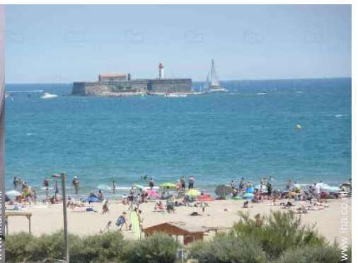
uitzicht vanuit het appartement