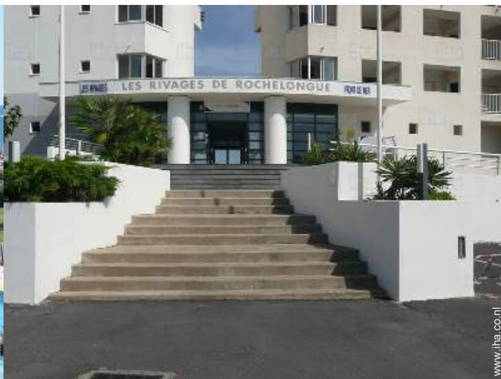
Residentie van standing