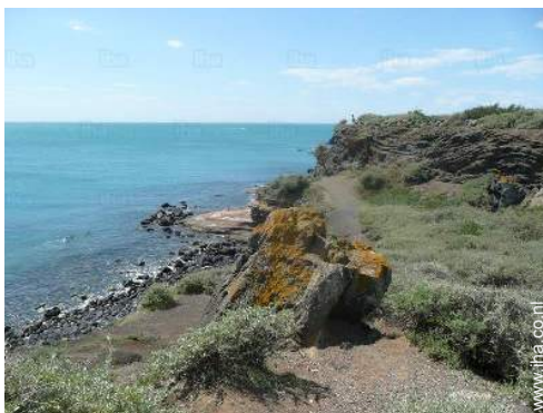
Zicht op zee