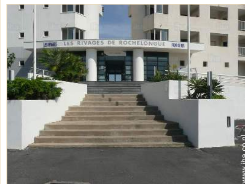
Residentie van standing