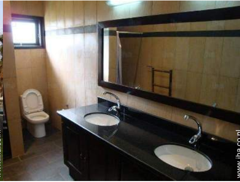
Badkamer(s) met douche