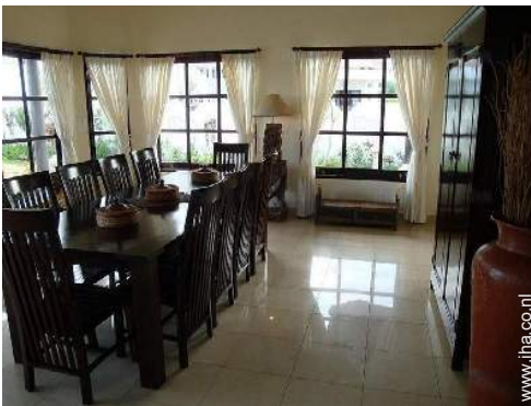
Binnenhuis inrichting en comfort