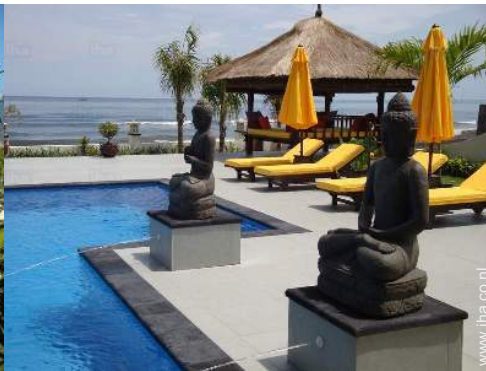
uitzicht op zee