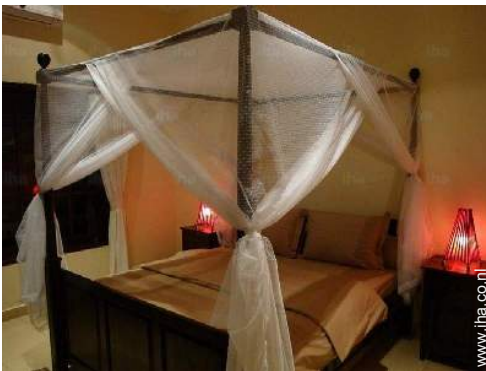
Slaapplaatsen - bed(den)