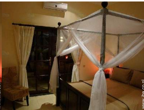
Slaapplaatsen - bed(den)