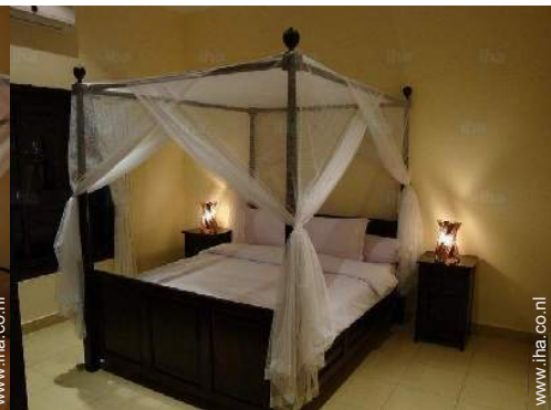
Slaapplaatsen - bed(den)