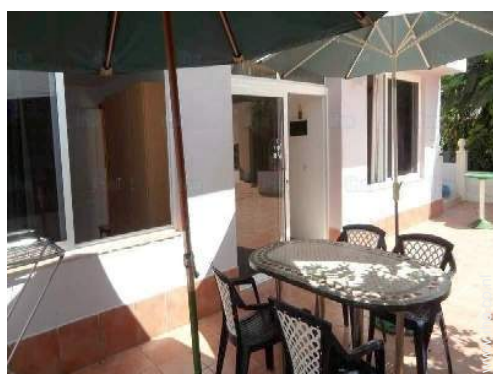
uitzicht vanaf het terras