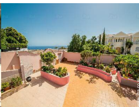
uitzicht vanaf het terras