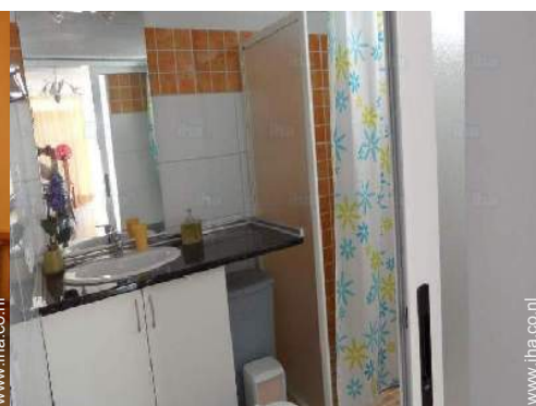
Badkamer(s) met bad