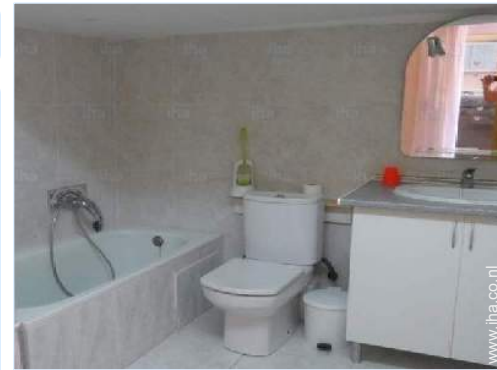
Badkamer(s) met bad

Barbecue, 4 tuinstoel(en), parasol, serre, 4 strandstoel(en)