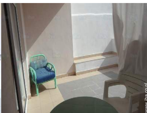
uitzicht vanaf het terras