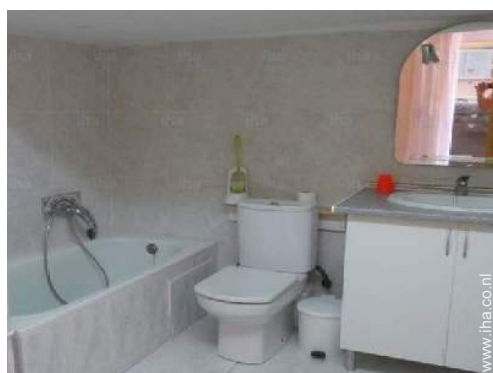
Badkamer(s) met bad