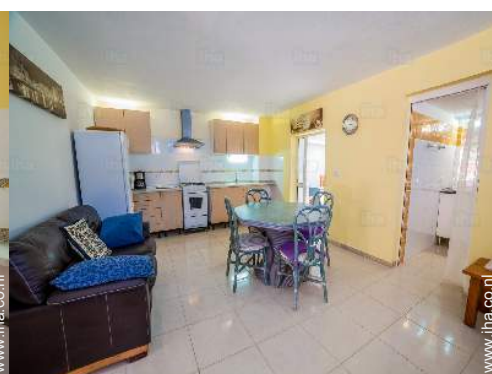
uitzicht vanuit de kamer