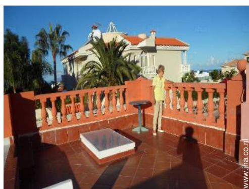
uitzicht vanaf het terras