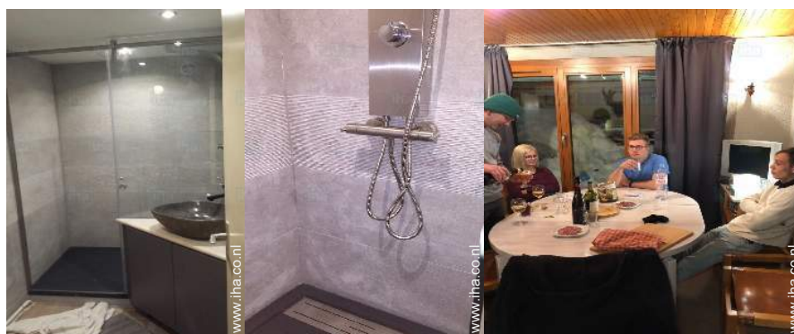
Badkamer(s) met bad