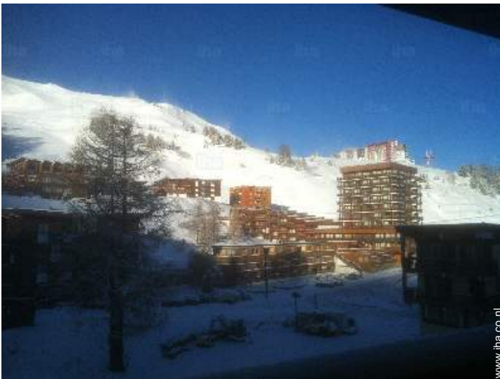
uitzicht vanuit de kamer