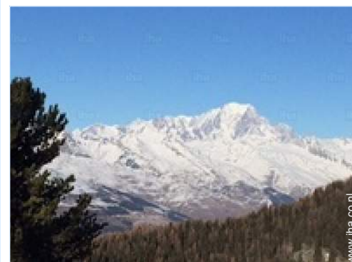
uitzicht vanuit de kamer