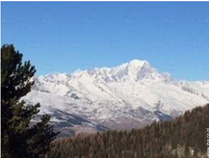
uitzicht vanuit de kamer