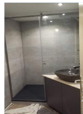
Badkamer(s) met bad