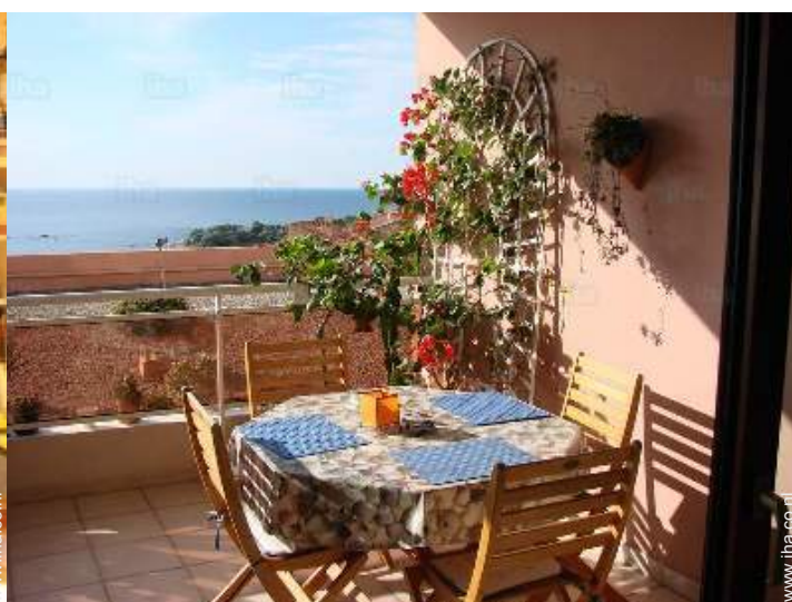
uitzicht vanuit het overdekte terras