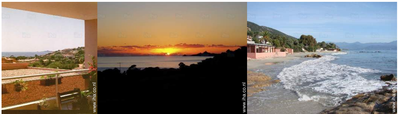
uitzicht vanuit het overdekte terras