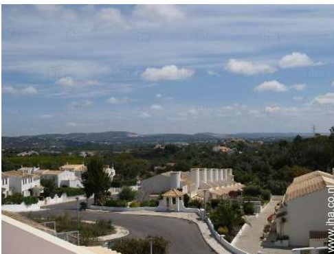
uitzicht vanaf de veranda