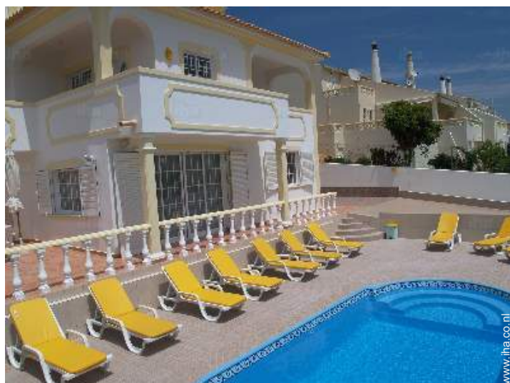
uitzicht op zwembad