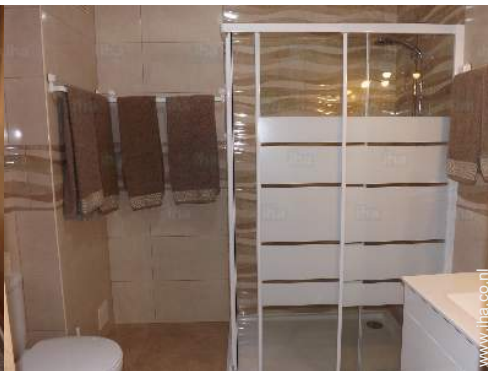
Badkamer(s) met douche