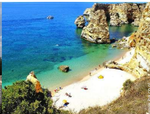
strandrecreatie in de buurt