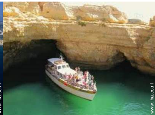
strandrecreatie in de buurt