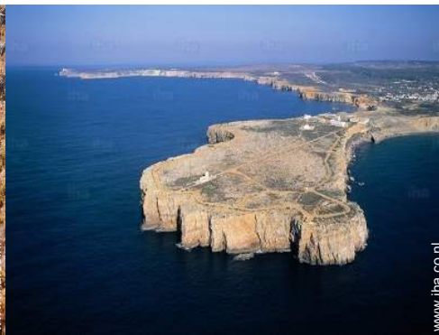
strandrecreatie in de buurt