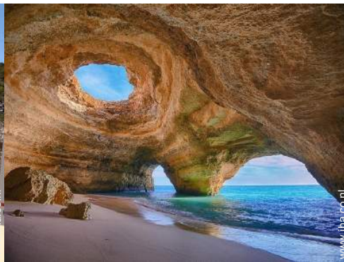
strandrecreatie in de buurt