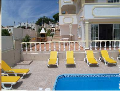
uitzicht vanaf het terras