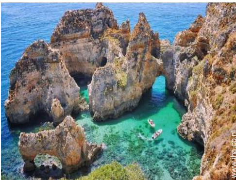
strandrecreatie in de buurt