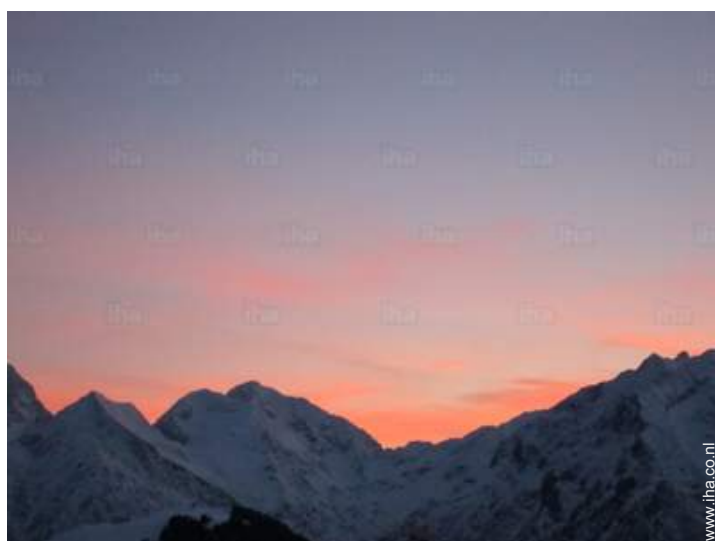
uitzicht vanuit het appartement