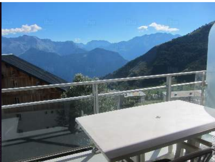
uitzicht vanuit het appartement