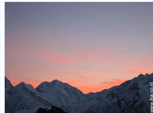
uitzicht vanuit het appartement